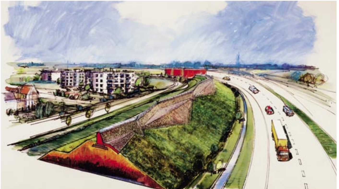
December 2003 uitgevoerd door Nautilus Schanskorven b.v. - Heiloo

Uitgevoerd door Nautilus Schanskorven b.v. te Heiloo In opdracht van Rijkswaterstaat Directie Oost-Nederland te Arnhem